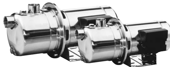
JE Motor encapsulado JES