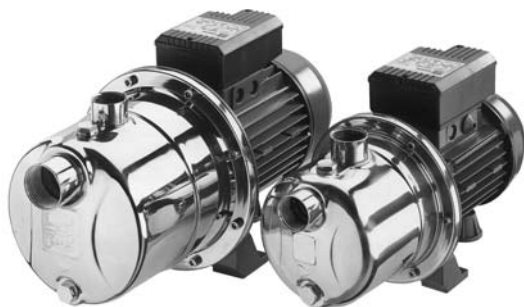
JEX Motor de aletas JESX

Electrobomba autoaspirante construida en Acero Inoxidable AISI 304 particularmente adecuada para el abastecimiento de agua potable, presurización doméstica, pequeños riegos de jardín, lavado de vehículos, vaciado-llenado de fuentes, piscinas y depósitos, incorporada a diferentes tipos de maquinaria industrial.