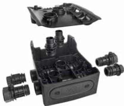
RACORES DE IMPULSIÓN Y ASPIRACIÓN DE 1" ¼